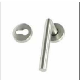
DURVIJU ROKTURIS HAFELE 902.92.402